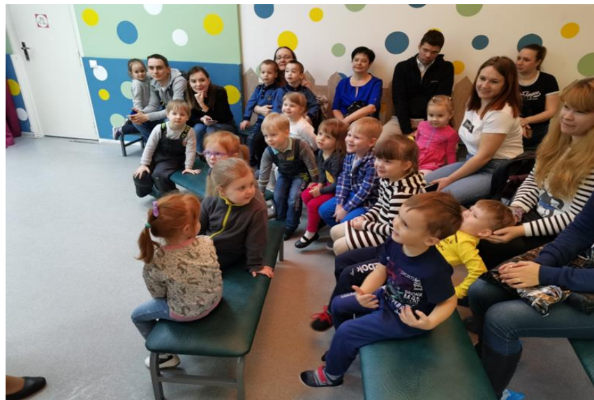
Первое посещение библиотеки во второй младшей группе «Рядом с домом» (март 2020 г.)

Ознакомление дошкольников с историко-культурным наследием родного края, воспитание гражданско-патриотических чувств и любви к родному городу должны начинаться с самого раннего возраста. Сделать это можно только посредством погружения в городское пространство.