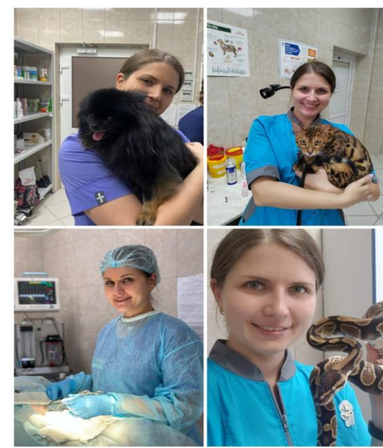
«Моя мама - профессионал»