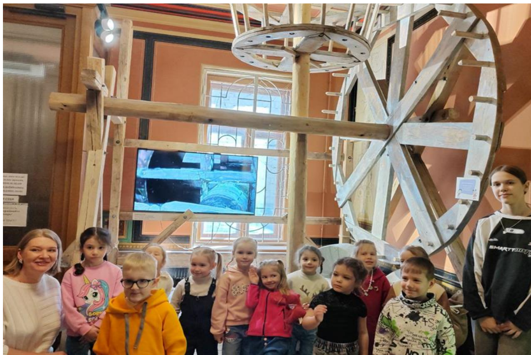
Экскурсия в Музей хлеба (апрель 2025 г.)