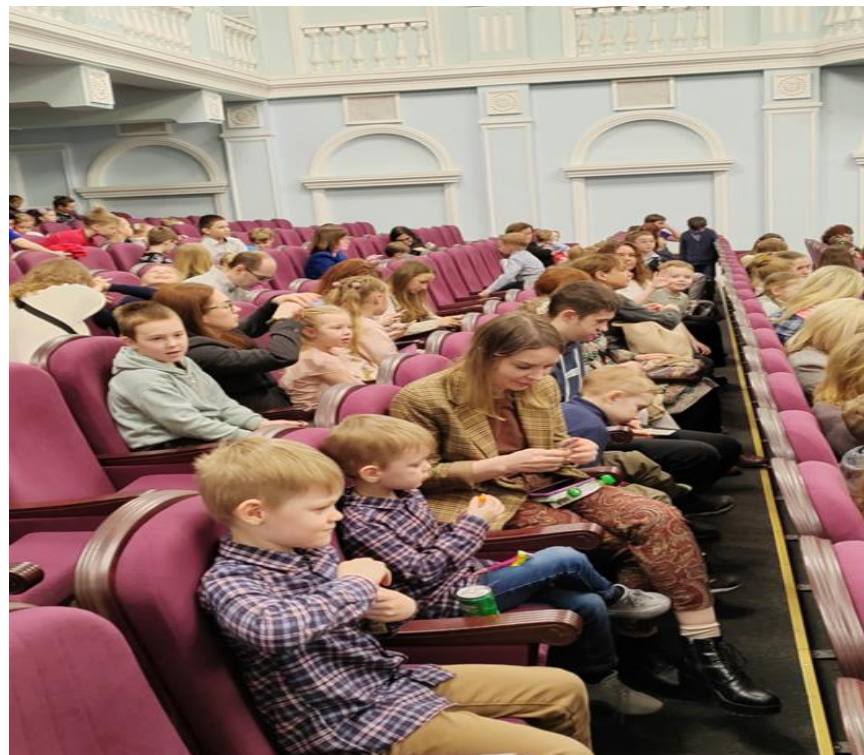
Посещение детского драматического театра «На Неве» (апрель 2022 г.)