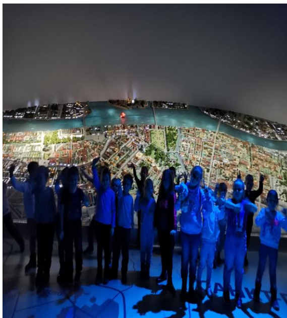
Экскурсия в Музей воды (март 2023 г.)

Содержательный компонент Программы включает в себя три взаимосвязанные содержательные линии ознакомления дошкольников с городским пространством: городские объекты, городская природа, люди – жители города.