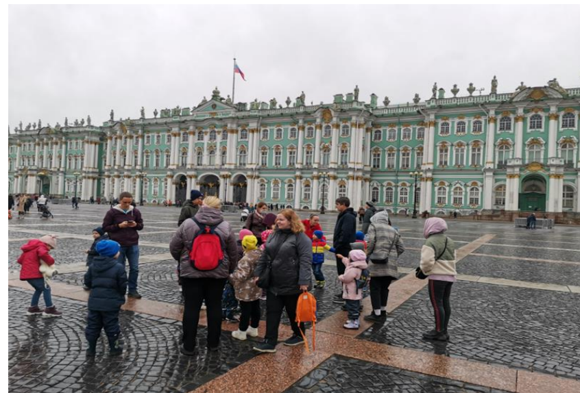
Первая автобусная экскурсия с экскурсоводом в средней группе «Прогулка по осеннему городу» (октябрь 2020 г.)