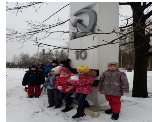
Подготовительная группа Автобусная экскурсия с экскурсоводом «Дорога Жизни» (январь 2022 г.)