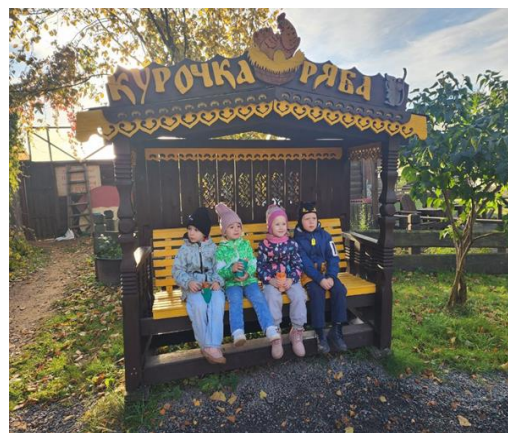
Средняя группа Посещение крестьянской усадьбы «Куричка Ряба» (сентябрь 2024 г.)