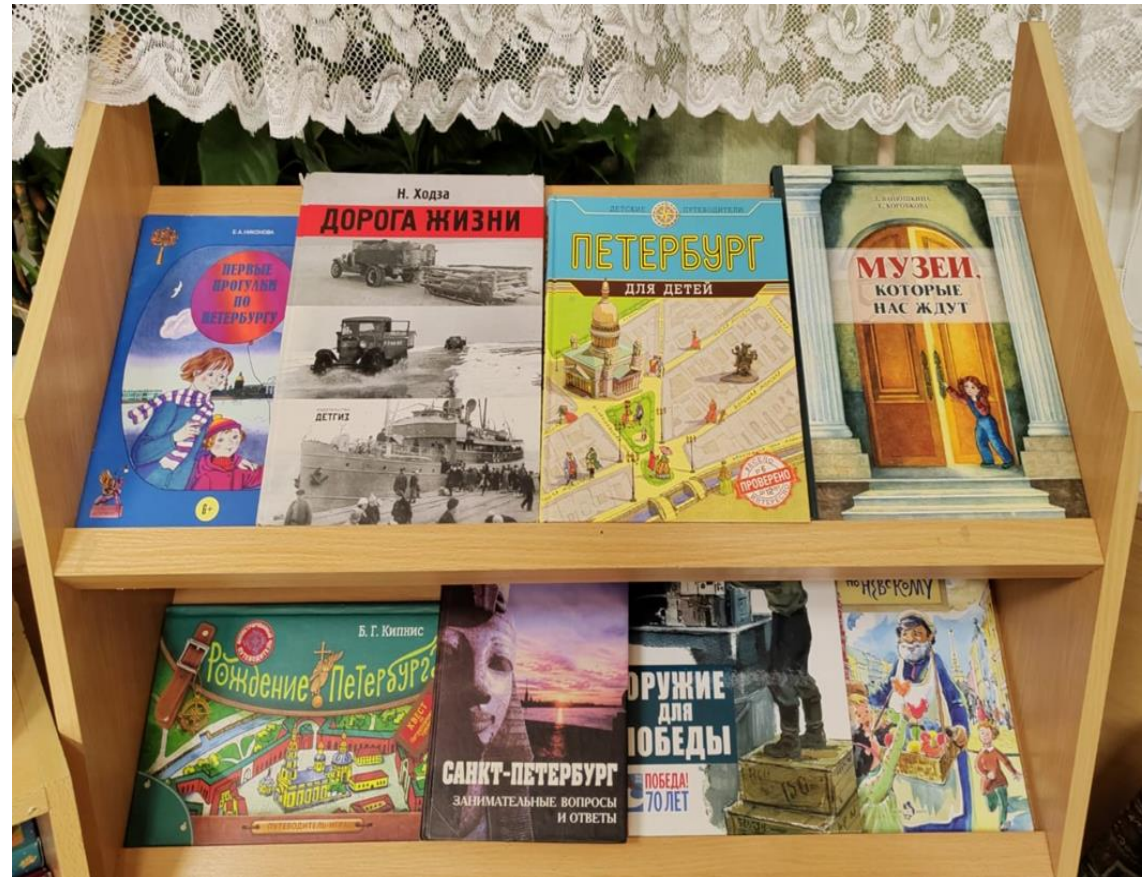
Литература о Санкт-Петербурге