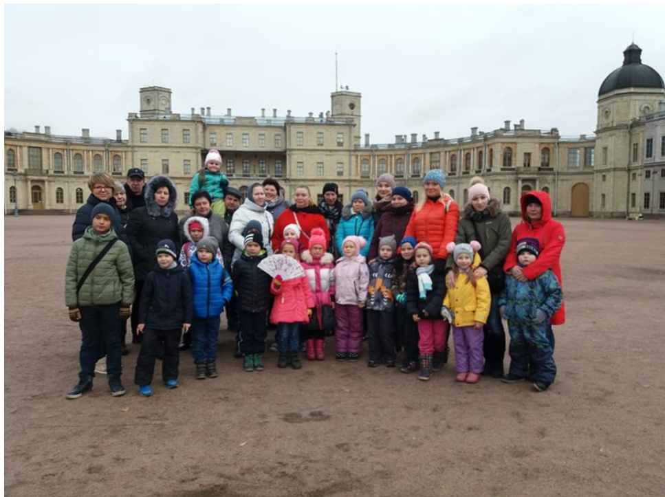
Автобусная экскурсия с экскурсоводом «Гатчина» (ноябрь 2022 г.)