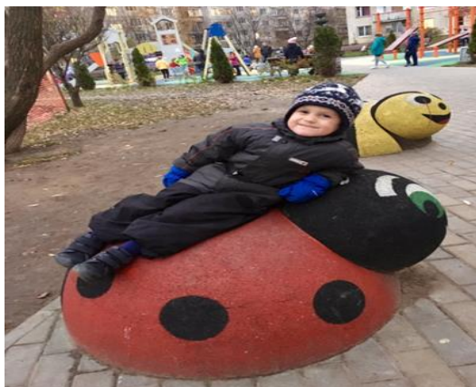
Вторая младшая группа «Моя любимая площадка» (октябрь 2023 г.)