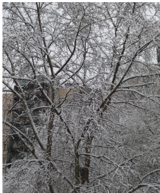
«Что мы видим из окна?»