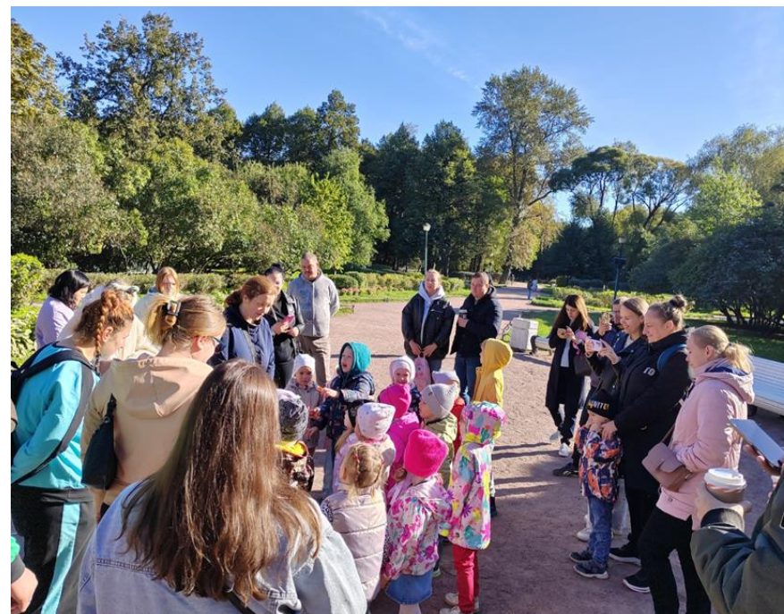
Пешая экскурсия во второй младшей группе с экскурсоводом «Осенний Таврический сад» (сентябрь 2023 г.)