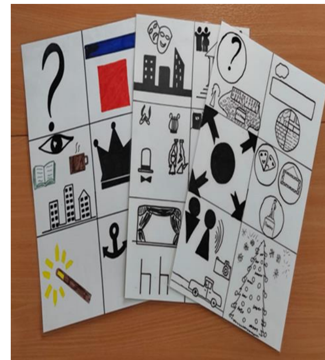
Мнемотаблицы для составления рассказов о городе