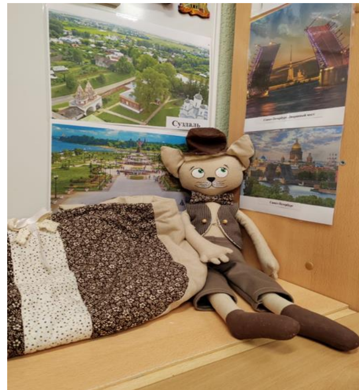
Дидактическая кукла кот Василий