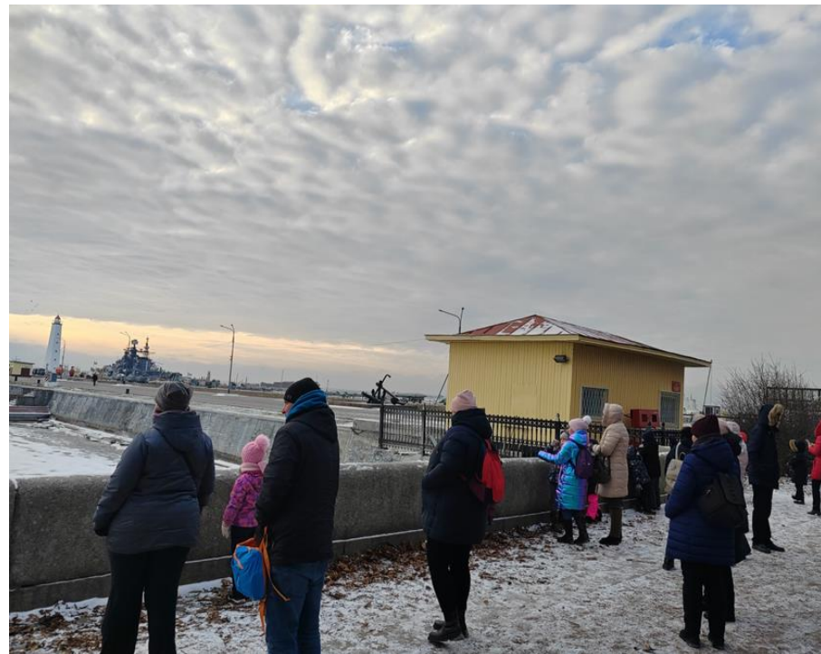
Автобусная экскурсия с экскурсоводом «Кронштадт – город воинской славы» (февраль 2023 г.)