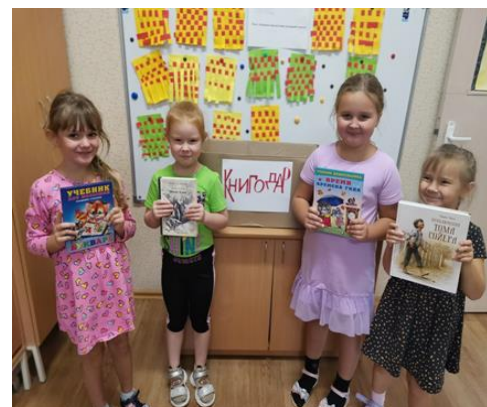
Старшая группа Акция «Книгодар» (ноябрь 2021 г.)