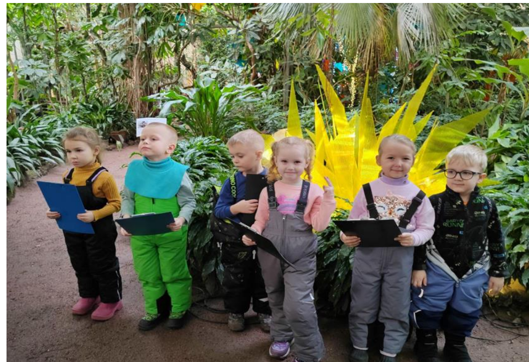
Экскурсия в Ботанический сад (январь 2025 г.)