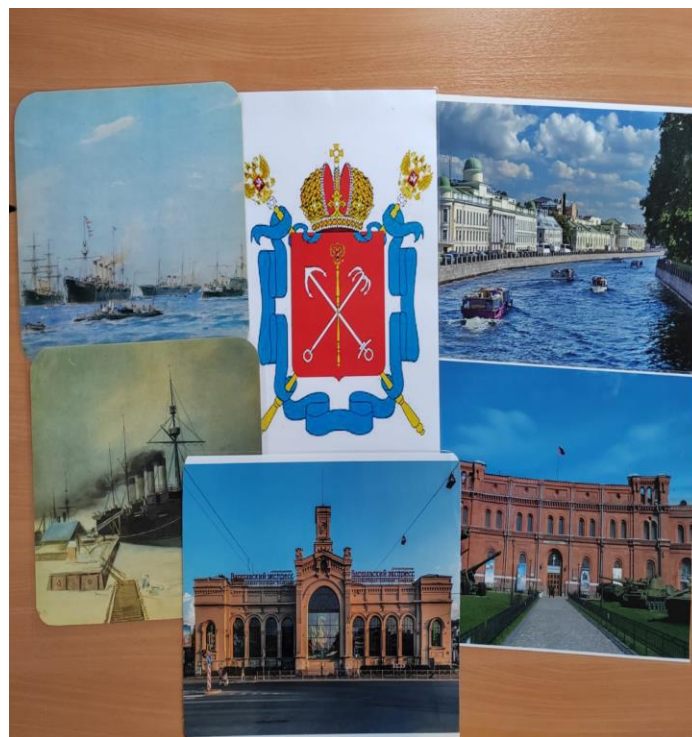
Демонстрационные материалы в РППС группы