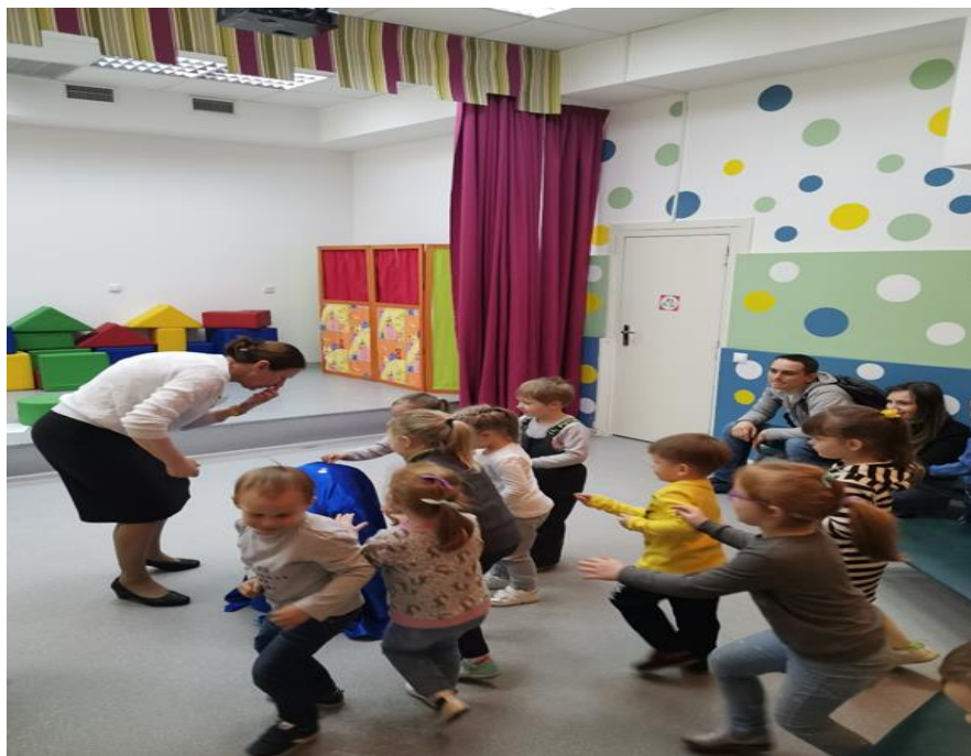
Первая экскурсия во второй младшей группе «Рядом с домом» в детскую библиотеку «Город» (март 2020 г.)