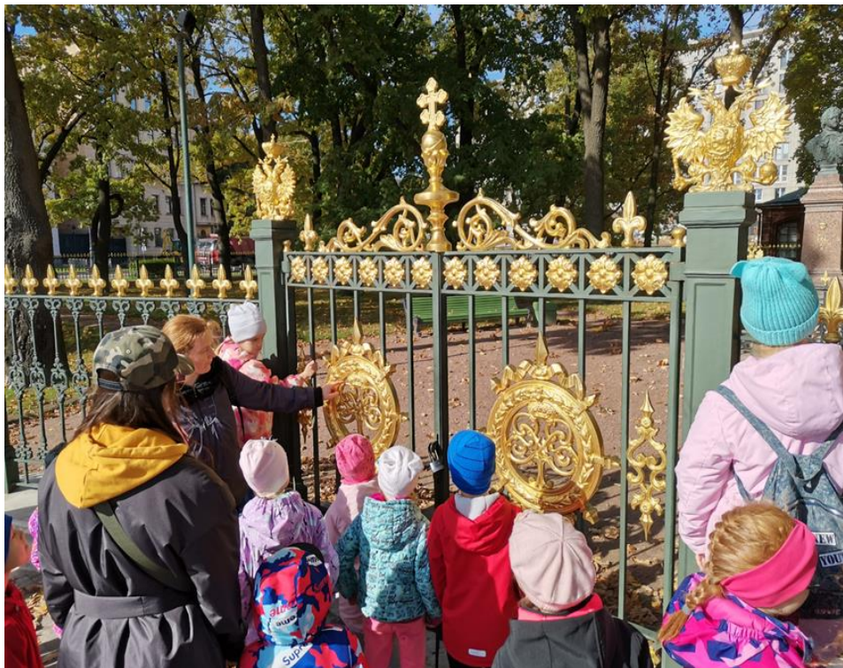
Пешая экскурсия с экскурсоводом «Шагами Петра» (сентябрь 2021 г.)