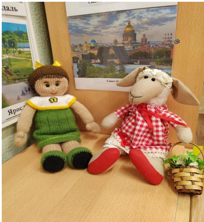
Дидактические куклы Ася и Тася