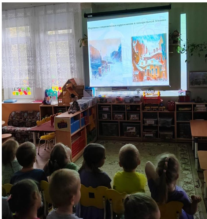
Подготовка ЭОР для проведения занятий