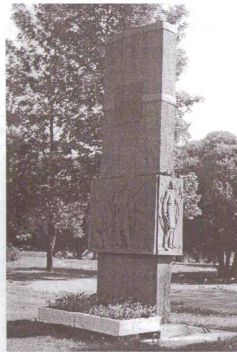
Стела, посвященная событиям Великой Отечественной войны, на Шоссе Революции

В тяжелые годы войны и блокады Ленинграда Большая Охта практически являлась частью легендарной «Дороги жизни», так как здесь, в Красногвардейском районе в начале Шоссе Революции сливались два потока транспорта, идущих от Финляндского вокзала и Смольного. На углу Большеохтинского проспекта и Шоссе Революции находился первый регулировочный пост, на-