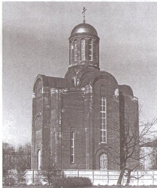
Храм Пресвятой Богородицы

Место для будущего храма, проект которого разработан известным петербургским архитектором Феликсом Романовским, выбрано не случайно. Во время блокады здесь, на Охте, располагалось кладбище, преданное впоследствии забвению. Постройка храма должна будет ликвидировать эту забывчивость потомков. Здесь будут молиться о здравии бывших жителей блокадного города и за упокой погибших.