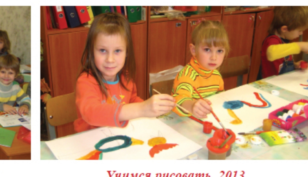
Учимся рисовать. 2013

Занятия проходили утром в специально оборудованных кабинетах в небольших группах. Дети имели возможность попробовать себя в различных видах деятельности, что позволяло развивать их способности и таланты.