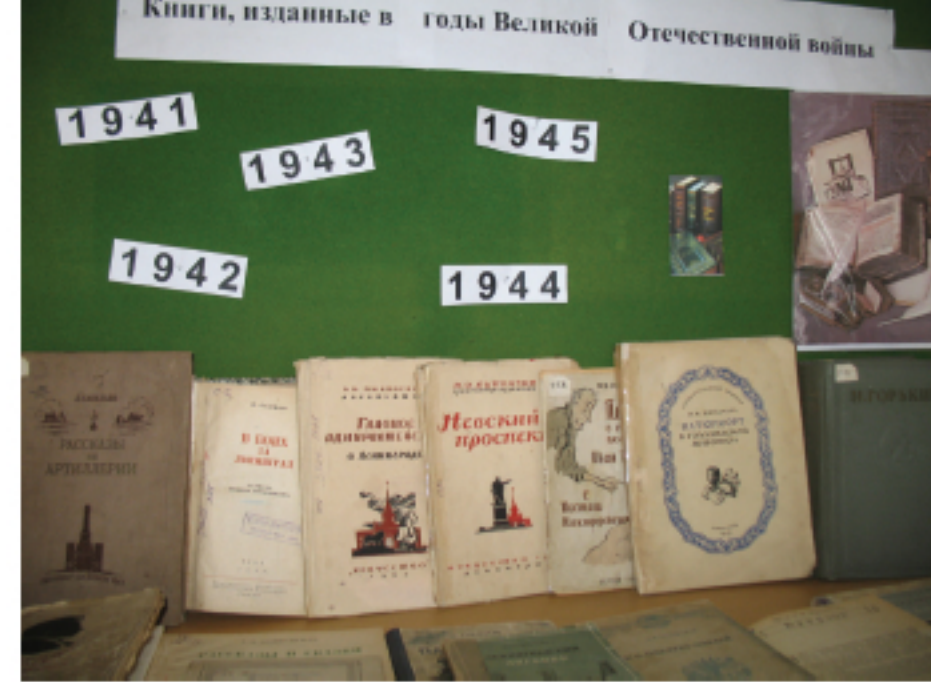
Книги из фондов библиотеки, изданные в годы Великой Отечественной войны. Сер. 2000-х