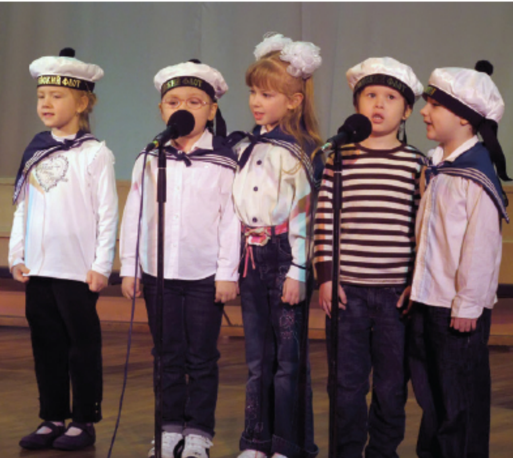
Праздник 8 марта. 2011

В 2014 году в Школе занималось более 100 детей в возрасте от 3-х до 6 лет. Малыши обучались по комплексной программе, включающей развивающие занятия, ритмику, пластику, изобразительное искусство, художественный труд, музыку, народное творчество, подготовку к школе.