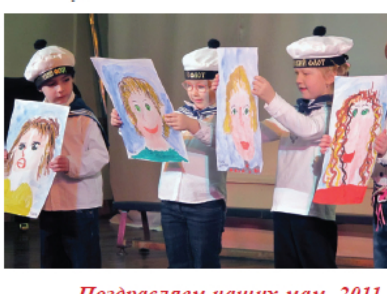
Поздравляем наших мам. 2011