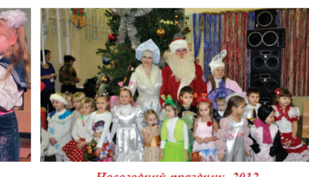
Новогодний праздник. 2012