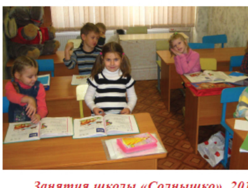
Занятия шкаты «Солнышко». 2013